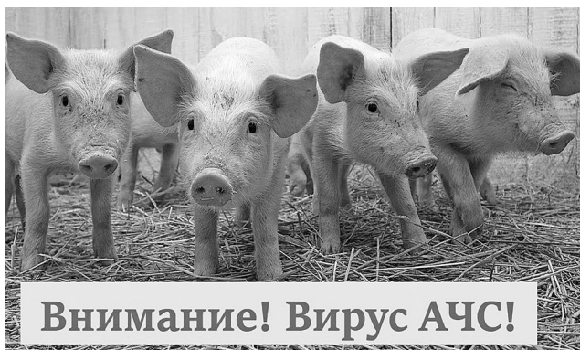
Внимание! Вирус АЧС!

В естественных условиях к болезни восприимчивы только дикие и домашние свиньи всех пород и любого возраста. Заражение чаще происходит алиментарным (кормовым) путем, реже – при контакте с инфицированными свиньями (в том числе и с дикими кабанями). Возможен занос заболевания с инфицированными кормами, необеззараженными продуктами убоя больных свиней, транспортом, обслуживающим персоналом, предметами ухода. Диагноз на африканскую чуму свиней ставят комплексно на основании анализа эпизоотологических данных, результатов клинических, патологоанатомических и лабораторных исследований. В случае возникновения заболевания среди домашних свиней порядок обязательных действий указан в «Инструкции по АЧС» . Методик контроля заболевания в дикой фауне в РФ нет, что значительно осложняет деятельность ветеринарных специалистов. С учетом того, что с популяцией диких кабанов чаще всего сталкиваются люди, не имеющие ветеринарного образования,