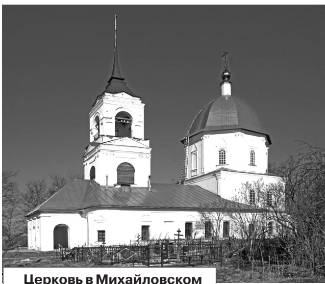
Церковь в Михайловском